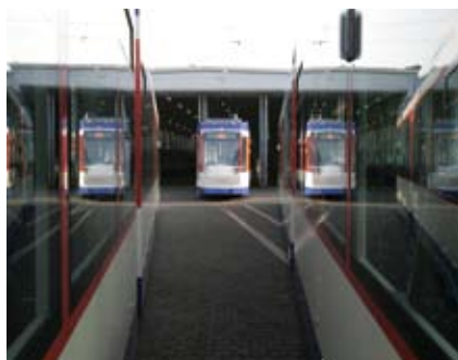
Früh morgens sind die Bahnen wieder startklar für ihren nächsten Einsatz im Linienbetrieb.

Aber auch die Fahrerinnen und Fahrer müssen mit den Gegebenheiten der Neufahrzeuge vertraut sein und wurden 2007 entsprechend geschult. Erhöhte Anforderungen gelten zudem insbesondere für das Busfahrpersonal. Der Fahrkartenverkauf beim Fahrer verlangt umfassende Tarifkenntnis. Auch die kassentechnische Abwicklung der Fahrgeldeinnahmen ist für alle Busfahrer inzwischen Tagesgeschäft.